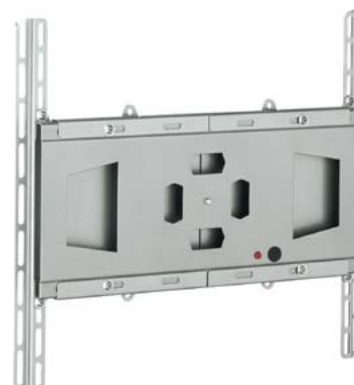
Vaste wandmontage (muurbeugel)

Door middel van een standaard muurbeugel kunt u het Vidi-Touch scherm op de muur monteren. De muurbeugel is netjes weggewerkt en het systeem is bevestigd aan de muur.