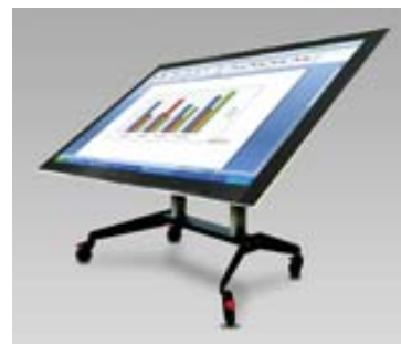
Kantelbare tafel model