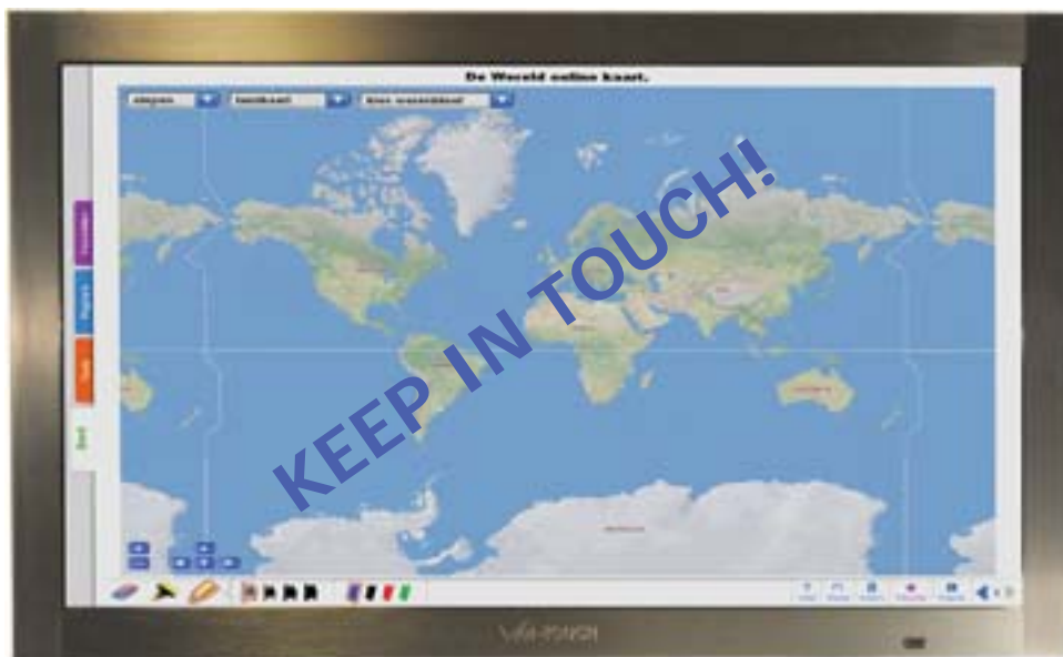
Product van Vidistri