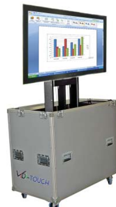
Electrisch in hoogte verstelbare flightcase